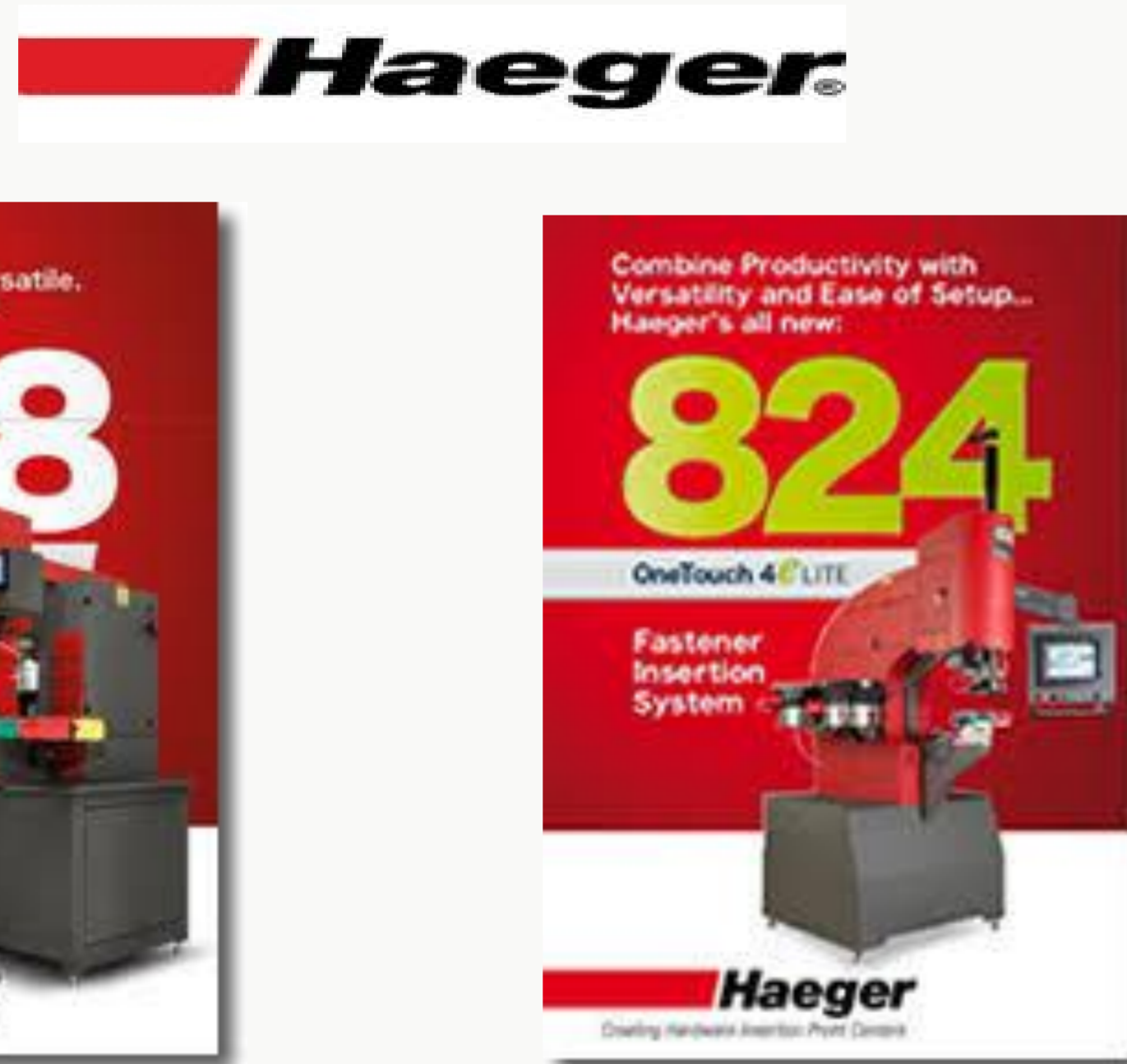
Fig.2. Tipuri de utilaje

Utilajele folosite pentru inserarea pem-urilor sunt roboții industriali de la HAEGER