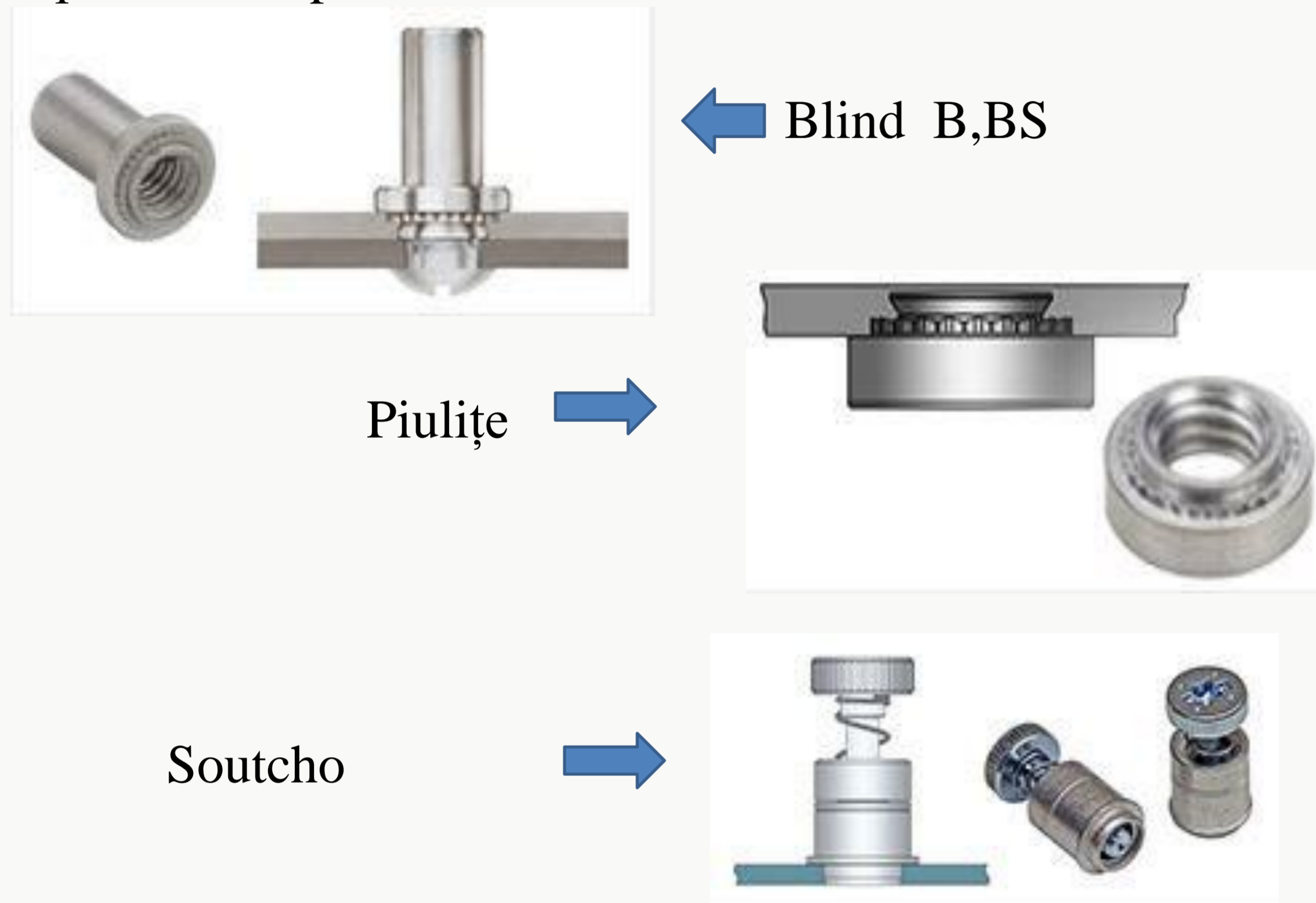
Fig.1. Tipuri de Pem-uri

În Faist Metalworking există o gamă largă de produse din diferite materiale de tablă care sunt supuse anumitor procese de prelucrare din care și procesul de INSERARE. Inserarea consta în presarea unor elemente de fixare "Pem-uri" în diferite tipuri de material. Toate piesele sunt produse în urma cerințelor clienților și verificate după anumite procese.